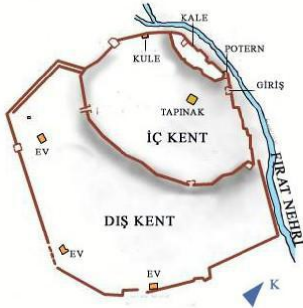
Aşağı Şehrin Planı